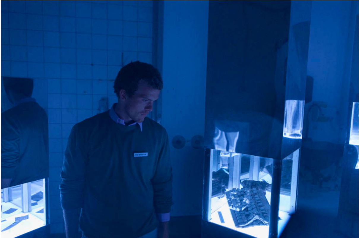
Fra forestillingen Martyrmuseum (2016).